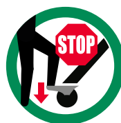
Aparque el Ben's Cart

Asegure el Ben's Cart detrás del coche del cliente utilizando la rueda con freno. Suelte el arnés de seguridad del carro y levante al niño hasta el carro. Abroche el sistema de retención de seguridad. Suelte el freno de la rueda trasera y... ¡en marcha!