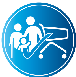
EL 212 BEN'S CART Carro de autoservicio con asiento y cinturón de seguridad